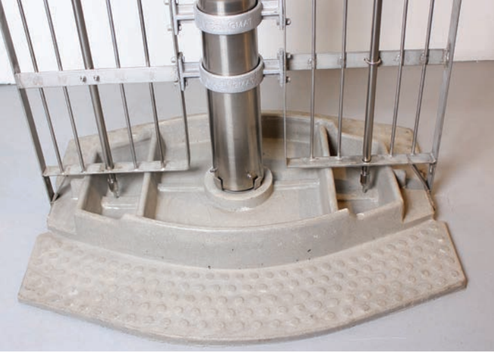
VissingMat 100: Polymer beton trug