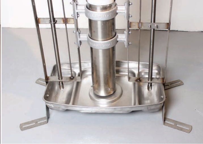
Maxi+: Rustfrit stål trug