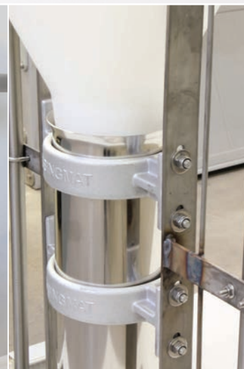
Foderrør og førringsrør